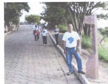
Estrada Real - Embaú

Fone – (12) 31562043 E-mail – jornada.perseveranca@bol.com.br