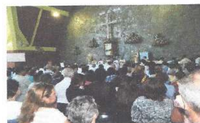
Matriz de São Miguel: Missa Festiva das 10:00h