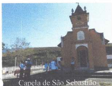
Capela de São Sebastião

No bairro do Itabaquara, com o apoio do Natan, fomos recebidos por Clarete na Capela de São Sebastião, com um delicioso café da manhã.