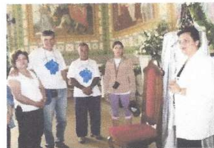
Igreja de Frei Galvão