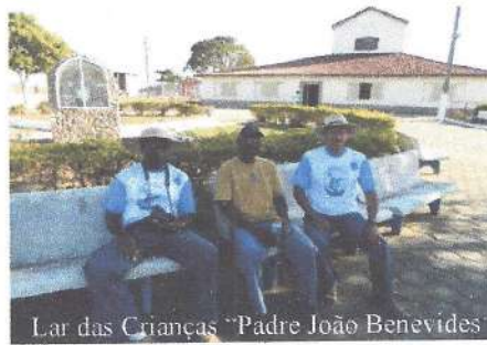
Lar das Crianças "Padre João Benevides"

Na Igreja consagrada ao Frei Galvão, em Guaratinguetá, quem nos transmitiu informações sobre o primeiro santo brasileiro foi o Sr.