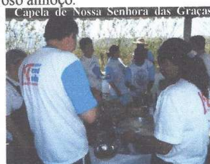
Capela de Nossa Senhora das Graças